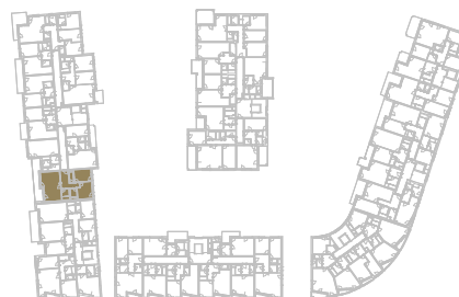
Schéma podlaží _____