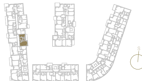
Schéma podlaží _____