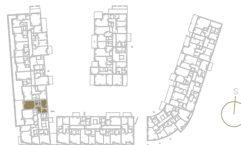
Schéma podlaží _____