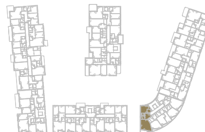
Schéma podlaží _____